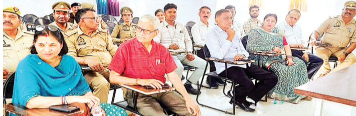
बाल कल्याण समिति को समय पर उपलब्ध कराने के निर्देश भी दिए गए। बैठक में जनपद में पंजीकृत और ललित गुमशुदगी बच्चों के मामलों तथा पॉक्सो एक्ट के अंतर्गत दर्ज अभियोगों की समीक्षा भी की गई। साथ ही जेजे एक्ट से संबंधित आदेशों और जनजागरूकता अभियान चलावने के निर्देश दिए गए। इस अवसर पर सीडब्ल्यूसी, श्रम विभाग, जिला प्रोबेशन विभाग, साइबर लाइन, प्रधान किशोर वयस्क बोर्ड, जन साहस, वन स्टॉप सेंटर सहित अन्य विभागों के अधिकारी और जनपद के सभी थानों के बाल कल्याण अधिकारी एवं कर्मचारी उपस्थित रहे।

बाल श्रम, बाल विवाह, बाल शिक्षावृत्ति की रोकथाम, लैंगिक समानता, साइबर काइम, एस्सी-एस्टी एक्ट तथा बाल विवाह मुक्त भारत अभियान जैसे महत्वपूर्ण विषयों पर जानकारी दी गई। साथ ही नारी शक्ति, किशोर वयस्क अधिनियम 2015 में हुए नवीन संशोधन तथा पॉक्सो एक्ट से संबंधित मामलों में आवश्यक कानूनी प्रक्रियाओं पर भी प्रशिक्षण दिया गया। अधिकारियों को निर्दिष्ट किया गया कि पॉक्सो एक्ट के तहत दर्ज मामलों की सूचना 24 घंटे के भीतर बाल कल्याण समिति (सीडब्ल्यूसी) को दी जाए तथा फार्म ई, ही और एस्सीआर रिपोर्ट समय से प्रेषित की जाए। इसके अलावा पॉक्सो मामलों में अपराधियों को उच्च व्यायालय से मिलने वाली जमानत की सूचना वादी या पीड़िता तथा