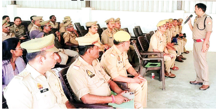
कर्मचारी निर्धारित समय से पहले अपने-अपने परीक्षा केन्द्रों पर पहुंचकर ड्यूटी ग्रहण करने को कहा। ब्रीफिंग के दौरान निर्देशित किया गया कि सभी पुलिस अधिकारी एवं